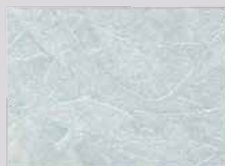
SA 2 512