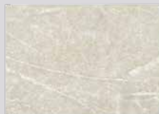
SA 2 516